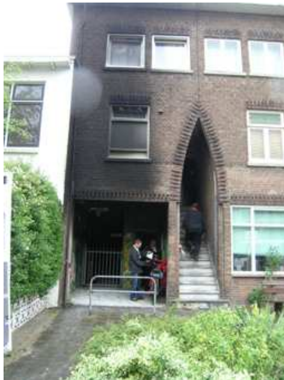
De onderdoorgang met de ingang van onze werkruimte.

Zoals verschillende lezers van deze nieuwsbrief al weten, heeft er zaterdagavond 25 april 2009 een felle brand gewoed in de onderdoorgang naast onze werkruimte. De kunststoffen garagebox voor de motorfiets van de bovenbuurman die daar al enkele maanden stond, was in brand gestoken.