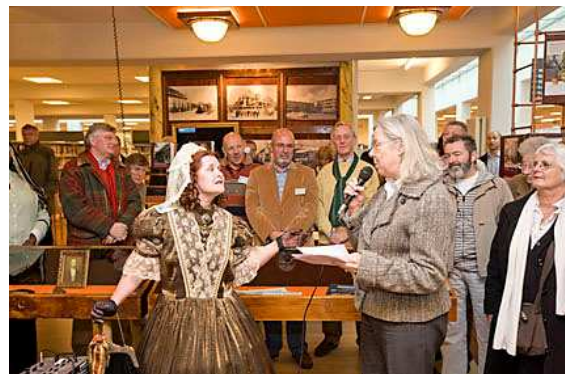
Prinses Marianne en wethouder Zwartepoorte openen het historisch informatiepunt.

Zoals u in de vorige Nieuwsbrief hebt kunnen lezen, is op zaterdag 4 april de openingshandeling van Toen Leidschendam-Voorburg verricht in de Bibliotheek van Voorburg. Dat gebeurde door niemand minder dan Prinses Marianne zelf, vergezeld door wethouder Zwartepoorte. Het bibliotheekpersoneel was voor de gelegenheid gekleed in historische kostuums.