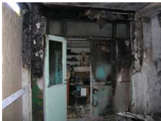
Flinke brandschade aan de achterdeur.

Hoewel de brand alleen aan de buitenzijde heeft gewoed, was de schade binnen in de werkruimte toch enorm. Alles, maar dan ook werkelijk alles, zat onder een laag roet. Direct dezelfde nacht nog zijn de computers, printer en scanapparatuur afgevoerd naar een gespecialiseerd schoonmaakbedrijf. Helaas bleken zij zodanig aangetast dat alleen de harde schijven van de computers nog te redden