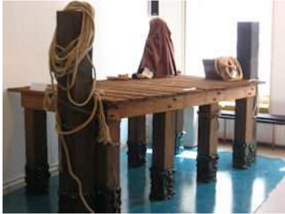
Reconstructie havenpalen bouwterrein Nieuw Hadriani.