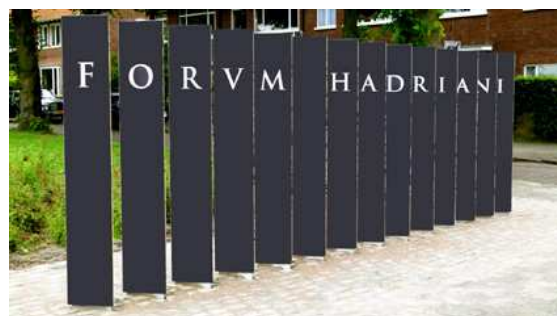
Het hoofdbaken van Forum Hadriani.

bezoek waard. Er zullen door ons twee rondleidingen worden gegeven waarbij wordt stilgestaan bij de nieuwe stadsbakens en bij de geschiedenis van de Romeinse stad. De rondleidingen beginnen om 12:00 uur en 14:00 uur bij het hoofdbaken op de hoek Prinses Mariannelaan/Arentsburghlaan en duren ongeveer een uur.