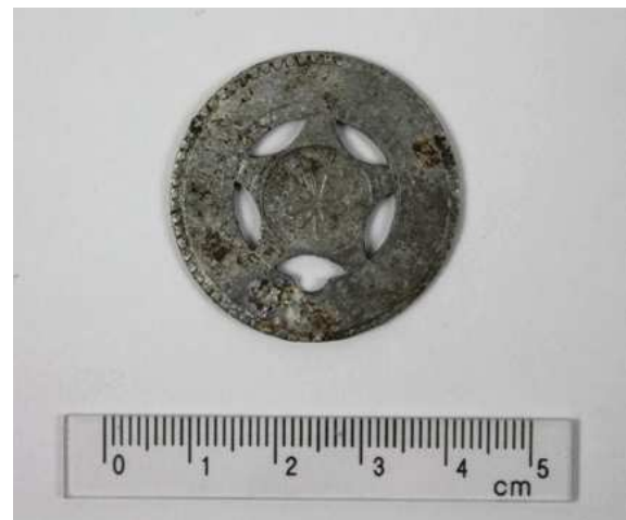
Voor- en achterzijde van de penning van Van Bohemen.