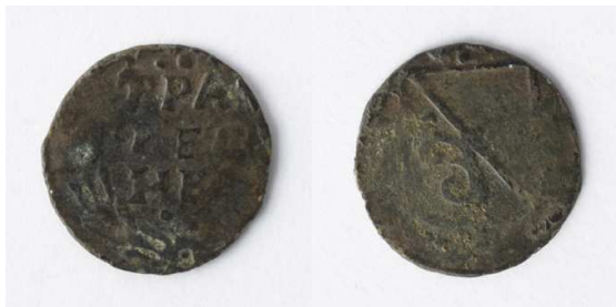
Voor- en achterzijde van de valse munt van boerderij Noorthey.

De heer van Reckheim – tot 1623 baron en daarna graaf – had van de Duitse keizer het recht gekregen om gouden, zilveren en koperen munten te slaan. Voor de voorziening van het graafschap hoefde hij zijn 'geldpers' geen overuren te laten draaien. Reckheim telde in 1631 namelijk niet meer dan 160 huizen en hoeven. De heer benutte zijn pers echter om imitaties van onder andere duiten uit de verschillende provincies en steden van de Republiek te maken en die daarheen te exporteren. Door de lage koperprijs was dat vooral in de eerste helft van de zeventiende eeuw een lucratieve handel. Hoewel ze dunner waren dan de echte duiten en niet helemaal identiek, kwamen ze toch op grote schaal in circulatie. Dat de tekst ook niet helemaal klopte, zoals in ons geval Trarechem in plaats van Trajectum, zal de minder geletterden nauwelijks zijn opgevallen.