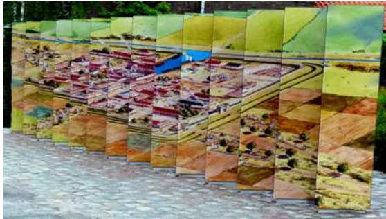
Het hoofdbaken met reconstructietekening van Forum Hadriani.

Brobbel. Ook is er een luchtfoto te zien met daarop aangegeven de contouren van de Romeinse stad. De stadsbakens in het park zijn gewijd aan de thema's geschiedenis, de stad, handel en vervoer, dagelijks leven en opgroeien in Forum Hadriani. In twee bakens is een vitrine met vondsten opgenomen.