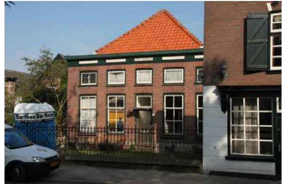
Boerderij 'Nooit Gedacht' voor de sloop.