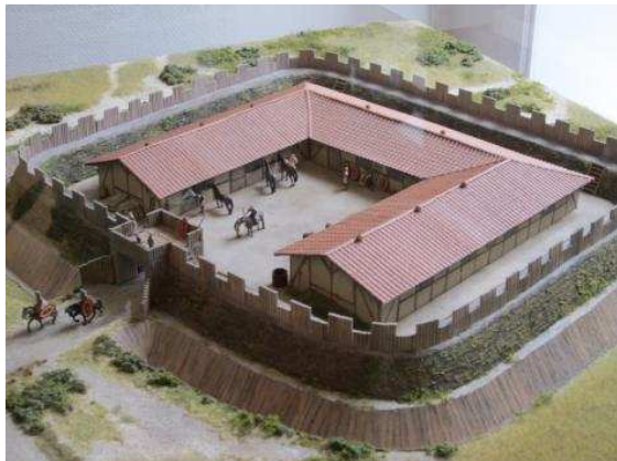
Maquette van het Romeinse fort Ockenburgh.

en een illustratie zien van het fort zoals het er toen waarschijnlijk uitzag. Verder zijn er diverse Romeinse attributen te bezichtigen, zoals sieraden, resten van soldatenschoeisel en aardewerkscherven met ingekraste letters. De expositie 'Het Romeinse Fort van Ockenburgh' loopt tot en met 31 oktober. Adres: Stadhouderslaan 37. Info: www.museon.nl .