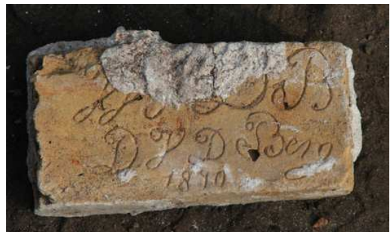
Ijsselsteentje met graffito uit 1870.