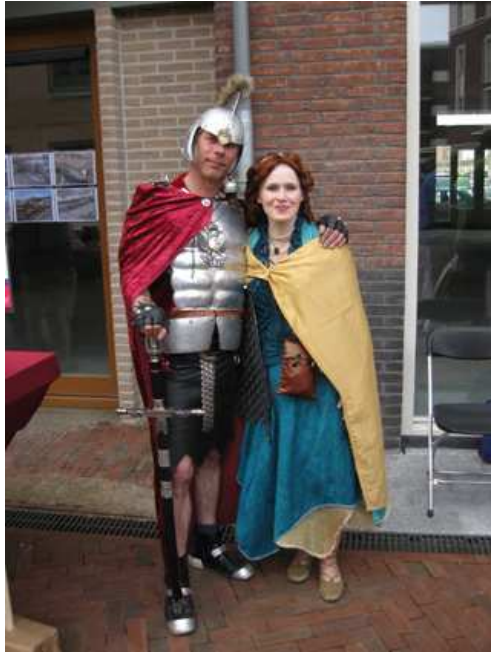
Re-enactors op het Damplein.