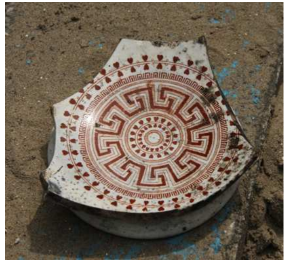
Fragment van een 19 e -eeuws bord.