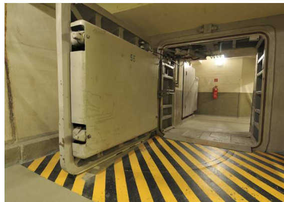
Een van de loodzware toegangsdeuren van de bunker.

Daarna reden we daar vlakbij de berg op naar het tweede punt van het programma: de Regierungsbunker. In de Silberberg is namelijk een tunnel uitgehouwen, aanvankelijk aangelegd als treintunnel, maar in de jaren '50 en '60 in het diepste geheim uitgebreid tot een enorme bunker, die in de Koude Oorlog diende als toevluchtsoord voor de Duitse regering in Bonn. Het complex omvatte maar liefst 17,3 km tunnel! Mocht de bom vallen, dan konden hier ca. 3000 mensen het een maand uithouden, compleet afgesloten van de buitenwereld.