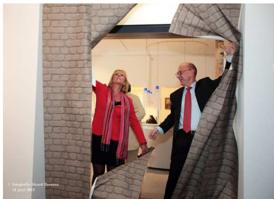
De wethouders openen de tentoonstelling.

Na een lange periode van verbouwen werd het Stadsmuseum Leidschendam-Voorburg op 21 juni eindelijk officieel heropend. De ruimte van de naastgelegen voormalige fietswinkel is nu toegevoegd aan het museum, waardoor het tentoonstellingsoppervlak significant is toegenomen. Bovendien is er aan de bestaande ruimtes ook flink verbouwd en heringericht en er is een lift geplaatst voor invaliden. De Romeinzaal is verhuisd en anders vormgegeven en op de gang boven is een rij vitrines gewijd aan de Stadsbakens.