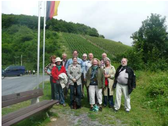
Groepsfoto buiten de regeringsbunker.

Eenmaal weer buiten na ons ondergrondse verblijf genoten we nog eens extra van het mooie weer en het prachtige uitzicht over het dal en de wijnvelden.