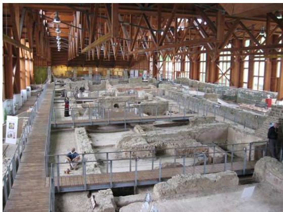
Overzicht over de Romeinse villa van Ahrweiler.

De vroegste fase van de villa dateert uit de 1 e eeuw na Chr. en was voorzien van o.a. een kelder en een eigen badgebouw met hypocaustum (vloerverwarming). Later in de 1 e eeuw werd de villa herbouwd en uitgebreid met een porticus met een monumentale toegangstrap. De muren waren beschilderd met fraaie muurschilderingen. In de laat-Romeinse tijd werd het gebouw gebruikt als mansio , herberg, en later als metaalsmelterij voor zilvererts uit de naastgelegen berg.