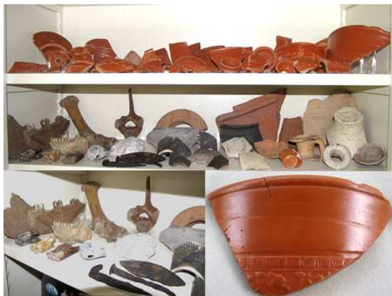
Een selectie van het vondstmateriaal thuis in de kast.

Maar voor een koppel gewone amateurs die het door de officiële opgravingsploeg vrijgegeven terrein gewoon afschoorde toch heel aardig spul: zoals een paar terra sigillata scherven (o.a. type 'Dragendorff 37') van bijna 20 cm groot. Een handvat van een grote amfoor met daarin duidelijke vingerafdrukken van de pottenbakker. Twee leeuwenkopjes van de schenktuiten van wrijfschalen. Ook een paar leesbare stempels: SOSIMIM en COMITIALI. Respectievelijk afkomstig uit Lezoux(?) en Trier en dateerbaar op 25 – 260 AD & 160 – 180 AD. Plus nog heel veel ander aardewerk en een fors aantal kilo's dakpanfragmenten.