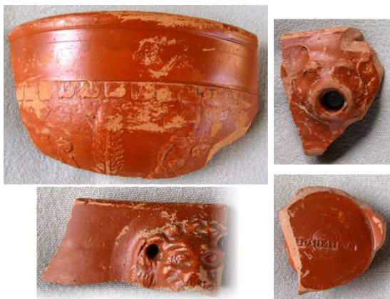
Enkele interessante stukken terra sigillata.

Uit het lijstje met meer dan honderd identificatienummers blijkt dat inderdaad vrijwel alles wat we hebben opgeraapt goed dateerbaar Romeins aardewerk is. En dan hebben we het nog niet eens over de tientallen stukken botmateriaal en natuursteen die vrijwel zeker ook door de bewoners van Forum