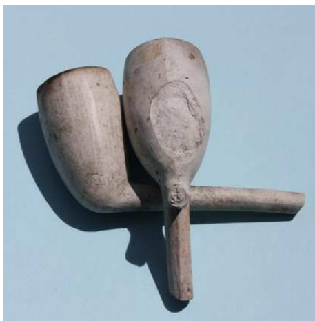
Twee kleipijpen van de Tollenskade.

Op basis van de scherven concludeer ik dat het een huisvuillaag is, gelegen op het veen (oud maaiveld) uit eind 18 e eeuw en begin 19 e eeuw, dus tussen 1850 en 1910. Mogelijk gestort of verwerkt omstreeks 1900.