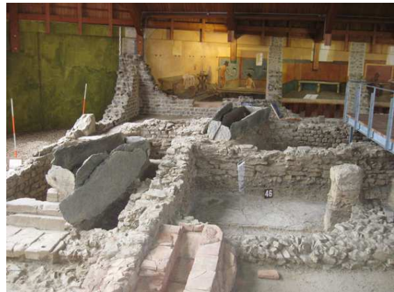
Bovenop de resten van het Romeinse badhuis zijn vroegmiddeleeuwse leistenen graven gevonden.

Daarna reden we daar vlakbij de berg op naar het tweede punt van het programma: de Regierungsbunker. In de Silberberg is namelijk een tunnel uitgehouwen, aanvankelijk aangelegd als treintunnel, maar in de jaren '50 en '60 in het diepste geheim uitgebreid tot een enorme bunker, die in de Koude Oorlog diende als toevluchtsoord voor de Duitse regering in Bonn. Het complex omvatte maar liefst 17,3 km tunnel! Mocht de bom vallen, dan konden hier ca. 3000 mensen het een maand uithouden, compleet afgesloten van de buitenwereld.