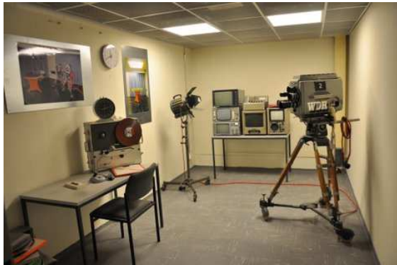
Er konden zelfs televisieopnamen gemaakt worden in de bunker.

Het grootste deel van de bunker is tussen 2001 en 2006 geheel ontmanteld, maar zo'n 200 m is nu als museum ingericht met originele spullen uit de jaren '60 en '70. Vrijwilligers leiden de grote aantallen bezoekers rond.